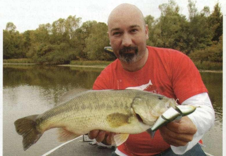
Toutes les nouveautés Illex testées pour vous p. 58