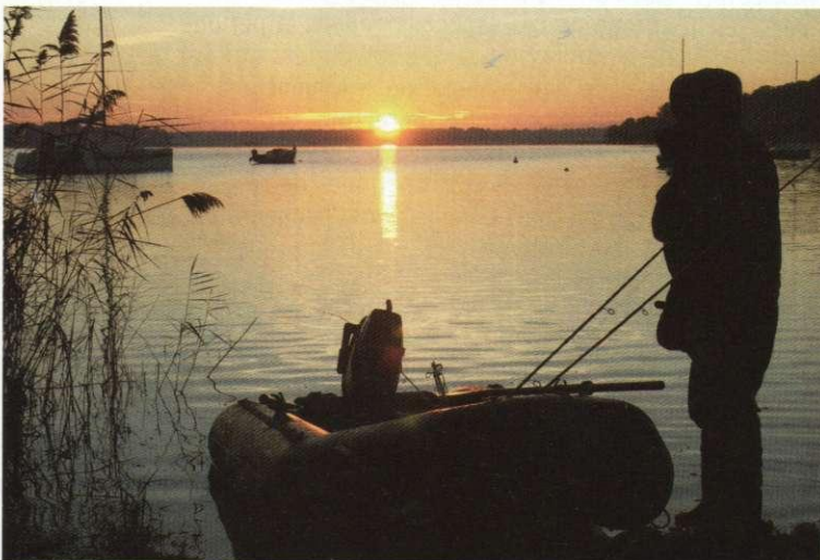
Magique coup du soir ! p. 52